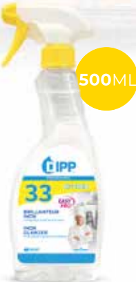
Dipp brillanteur inox 247412 - Spray de 500ml Colis de 6 sprays 12,35€** h.t. le spray