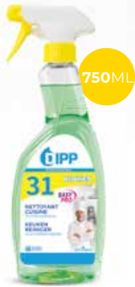
Dipp nettoyant cuisine 247352 - Spray de 750ml Colis de 6 sprays 7,20€** h.t. le spray