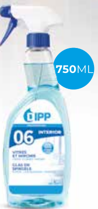
Dipp nettoyant vitre miroir 247364 - Spray de 750ml Colis de 6 sprays 5,10€** h.t. le spray