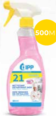
Dipp nettoyant détartrant inox 247359 - Spray de 500ml Colis de 6 sprays 7,25€** h.t. le spray