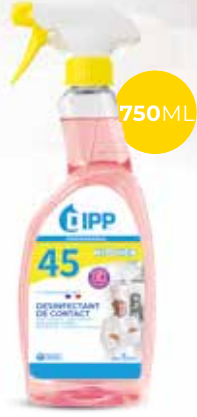
Dipp désinfectant de contact 247485 - Spray de 750ml Colis de 6 sprays 13,20€** h.t. le spray