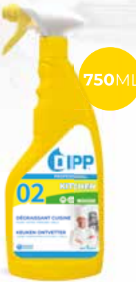
Dipp dégraissant cuisine mousse 247350 - Spray de 750ml Colis de 6 sprays 10,20€** h.t. le spray