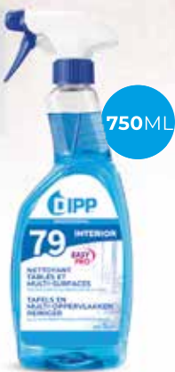
Dipp nettoyant table & multi-surfaces 247369 - Spray de 750ml Colis de 6 sprays 6,95€** h.t. le spray