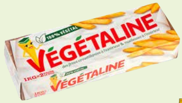
Réf. 58533 Végétaline Boîte de 2 pains de 500 g