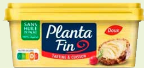
Réf. 21557 Planta fin doux Barquette de 225 g