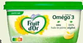
Réf. 40063 Fruit d'Or 1/2 Sel Barquette de 500 g