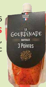
Réf. 26366 3 poivres Poivre Noir, Vert & Blanc