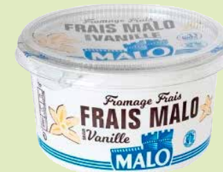
Réf. 16476 Fromage Frais Vanille Pot de 500 g