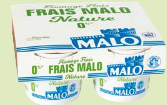
Réf. 63539 Fromage Frais 0 % Lot de 4 pots de 100 g