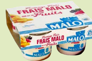
Réf. 179603 Fromage frais Sur Lit de fruit Lot de 4 pots de 100 g