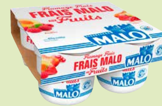
Réf. 179752 Fromage Frais fruits Lot de 4 pots de 100 g