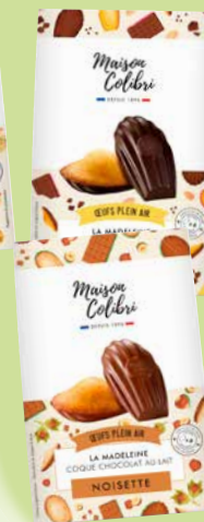
Réf. 92901 Madeleine Coquille Chocolat Lait x 6 Sachet de 156 g