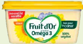
Réf. 143893 Fruit d'Or Omega Doux S/HP Barquette de 450 g