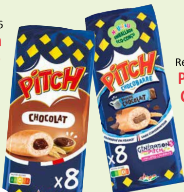
Réf. 49648 Pitch Barre Choco-Lait

(8 briochettes emballés individuellement)