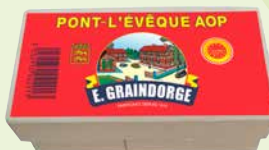
Réf. 40272 1/2 Pont L'Evêque AOP Pièce de 180 g