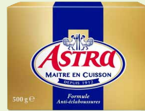
Réf. 144096 Astra Doux Maitre en Cuisson 70 %, Plaquette 500 g