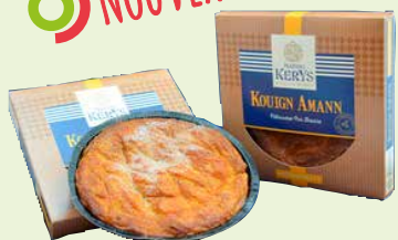
Réf. 26570 Kouign Amann Pièce de 350 g