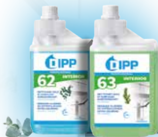
NETTOYANT SOLS ET SURFACES SURODORISANT RÉF 247354 - RÉF 247353