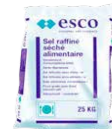
Sel fin raffiné 118200 - Sac de 25kg