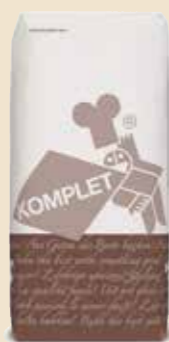
Complett plus sans sel ajouté 83592 - Sac de 25kg