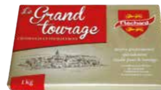
Beurre le Grand tourage 82% de M.G. 173373 - Plaque de 1kg Colis de 10 plaques