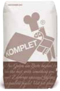
Pain à l'épeautre sans sel ajouté 83599 - Sac de 10kg

Un pain riche en saveur et au goût unique grâce à un parfait mélange, entre autres, de farine de seigle et de blé, de malt torréfié et de graines (tournesol, sésame et lin). Le pain forestier, c'est l'assurance d'une mie moelleuse, souple et alvéolée et une croûte croustillante.