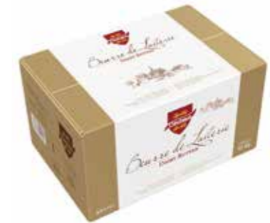
Beurre doux 82% de M.G. 116796 - Bloc de 10kg