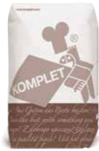
Pain forestier 50 sans sel ajouté 84158 - Sac de 10kg

Un pain riche en saveur et au goût unique grâce à un parfait mélange, entre autres, de farine de seigle et de blé, de malt torréfié et de graines (tournesol, sésame et lin). Le pain forestier, c'est l'assurance d'une mie moelleuse, souple et alvéolée et une croûte croustillante.