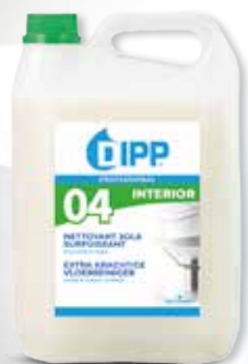
NETTOYANT SOLS SURPUISSANT RÉF 247365

Balai avec manche télescopique, housse microfibras etseau essoreur. Idéal pour un nettoyage en profondeur sans se mouiller les mains, sur tous types de sols.