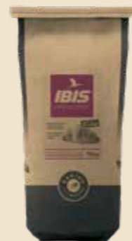
Ibis viennoiserie 115633 - Sac de 10kg