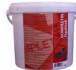
Completin plastique 115520 - Seau de 4kg