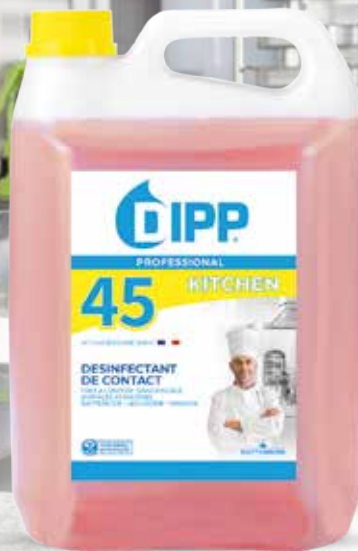
DESINFECTANT DE CONTACT DIPP N°45 5L Réf. 250558