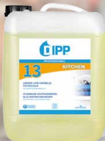
LIQUIDE LAVE-VAISSELLE TOUTES EAUX DIPP N°13 10L Réf. 247361