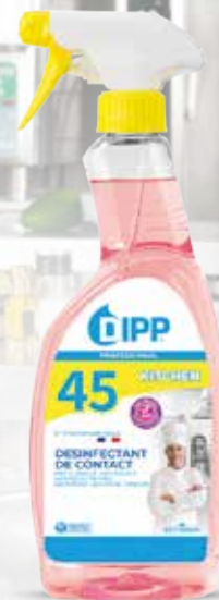
DESINFECTANT DE CONTACT DIPP N°45 750ml Réf. 247485