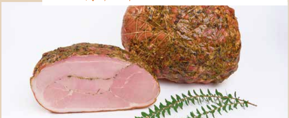
Sans polyphosphates et caséinates ajoutés.

160617 - Pièce de 7,5kg env. / Colis de 2 pièces