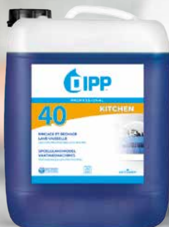
RINÇAGE ET SÉCHAGE DIPP N°40 10L Réf. 247357