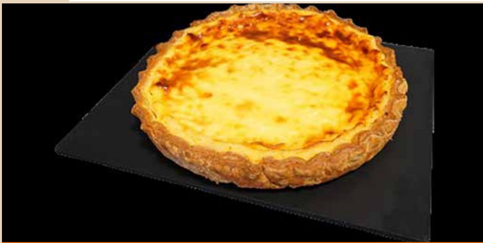
Fabriqué à base de lait et d'œufs Origine France

72514 - Pièce de 1,8kg env. / Colis de 2 pièces