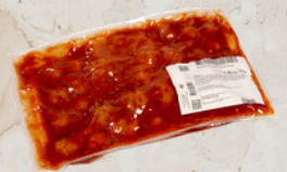
Boulette au boeuf sauce Milanaise 2.4kg EPC 165621