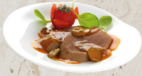
Langue de boeuf sauce piquante 2.4kg EPC 60709