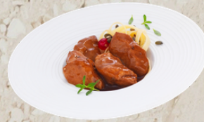
Sauté de porcelet à la bière de Noël et au sirop d'érable 1.95kg -EPC 33278