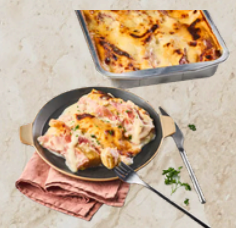
Endives au jambon supérieur 2.3kg Tino 165006