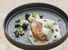
Pavé de veau aux morilles 1.6kg EPC 71950