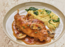
Cuisse de lapin sauce chasseur sous vide 2.12kg EPC 72716