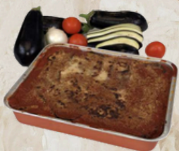
Gratin d'aubergines à la parmesane 3kg Marchio 28354