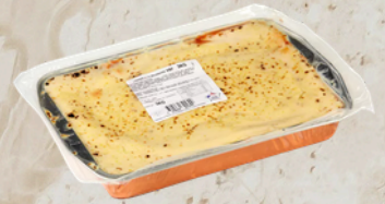
Lasagne bolognaise gratinée VF 3kg Stefano Toselli 162889