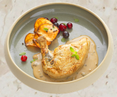
Suprême de pintade avec os sauce riesling et cèpes kit 1.8kg - EPC 71098