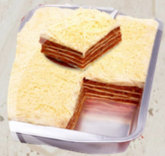
Lasagne bolognaise VF 3kg Mamma Mia 26298