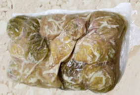
Chou farci châtaigne 5% 2K24 Jules Courtial 48310