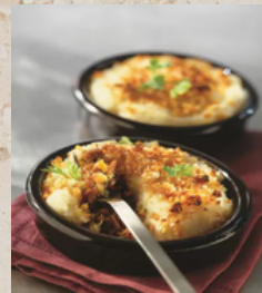
Parmentier de canard gratiné 2.8kg Tino 23836