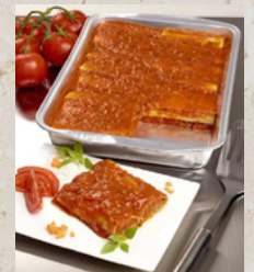
Cannelloni bolognaise VF 2.5kg What's Cooking 158140