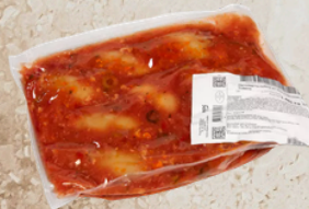
Encornets farcis et concassé tomates 1.8kg EPC 167356