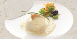
Turban de sole à la crème et au whisky EPC 167373