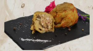
Choux farcis cuits au four 2.7kg Tino 159436