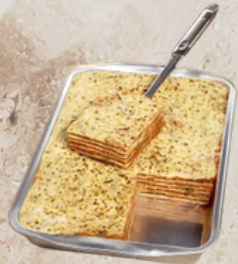
Lasagne aux légumes bio 3kg What's Cooking 158199