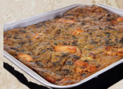
Gratin de saumon aux épinards 3kg Kirn 51183