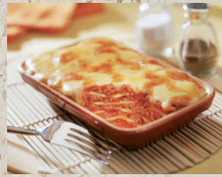
Lasagne bolognaise au porc avec 12 raviers 5kg What's Cooking 36640