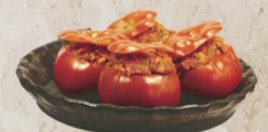
Tomates farcies avec riz 2.5kg Tino 164891