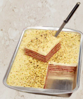
Lasagne bolognaise boeuf VF BIO 3kg What's Cooking 33730