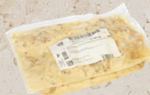
Blanquette de veau 2.16kg Epc 65076