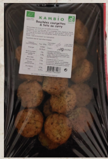
Bouchée de riz aux courgettes et à la feta au curry Bio x30 900g 22867