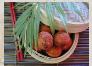
Acra de morue 20gx9 + sauce aigre douce Agis 154559