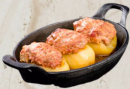
Pommes de terre farcies 2.7kg Tino 48371