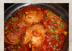
Osso bucco de dinde à la milanaise 2.24kg EPC 72715