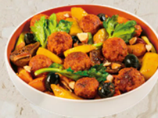
Boulette végétale tomate 160x12.5g Fabrique Veggies 52285