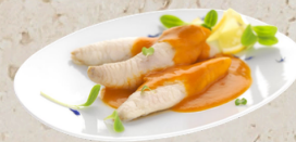
Filet de lotte sauce américaine 1.52kg EPC 160045