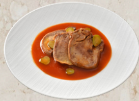
Langue de boeuf sauce piquante 1.8kg Gozoki 141721