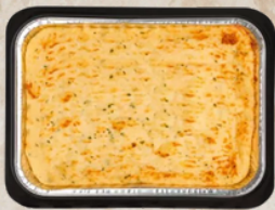
Brandade parmentière à la morue gratinée 3kg Tino 23900