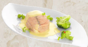
Paupiette de saumon beurre citron 1.44kg EPC 551286