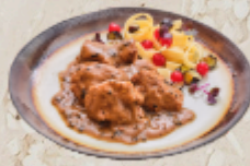
Fondant de cerf sauce pinot noir sous vide 1.7kg EPC 72800