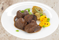
Sauté de sanglier sauce poivrade 1.7kg EPC 71535