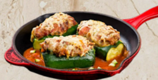
Courgette farcie ultra frais 1.9kg Tino 23344