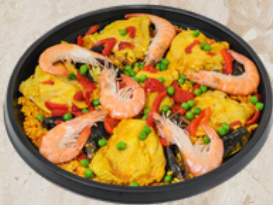
Paella Valenciana 3kg Tino 23895