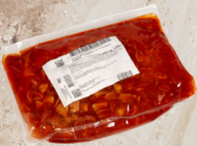
Poêlée de calamars à la catalane et au chorizo 2kg EPC 159069