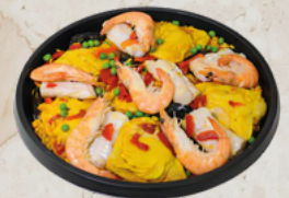
Paella royale 3kg Tino 29037