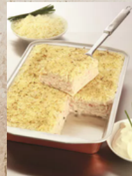
Lasagne aux 2 saumons pêche durable 3kg What's Cooking 164910