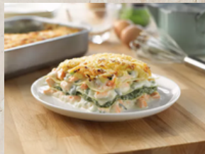
Lasagne aux 2 saumons aux épinards 3kg What's Cooking 31463