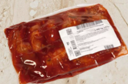
Paupiette de veau sauce champignon 2kg EPC 550386