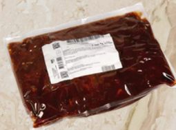
Carbonade flamande 2.35kg EPC 167354