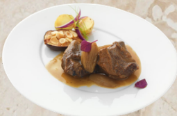
Joue de boeuf sauce raifort et échalotes 2.2kg EPC 165622