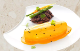
Quenelle au brochet sauce safranée 2.1kg EPC 165622