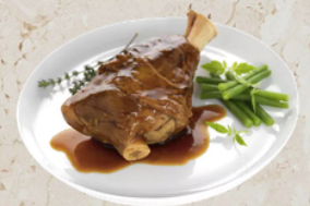
Jarret agneau au thym x6 2.64kg EPC 65077