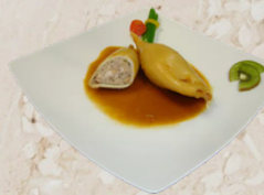
Calamar farci sauce américaine 1.5KG Tino 159437