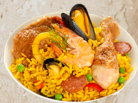
Paella au poulet kit 4.72kg EPC 65195