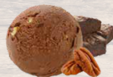
BROWNIES 2.5 L (16994)