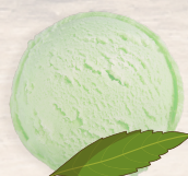
VERVEINE 0.5 L (19342) 2.5 L (29983)