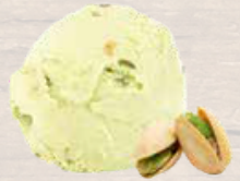
PISTACHE 0.5 L (19334) 2.5 L (29986)