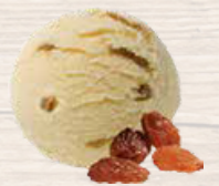
RHUM RAISIN 0.5 L (19335) 2.5 L (29985)