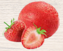
FRAISE 0.5 L (19347) 2.5 L (29998)