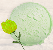
CHARTREUSE 2.5 L (16992) 0.5 L (201387)