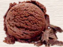
CHOCOLAT NOIR 0.5 L (19329) 2.5 L (29992)