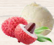
LITCHI 2.5 L (16996) 0.5 L (201386)