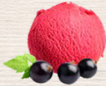
CASSIS 0.5 L (19345) 2.5 L (30000)