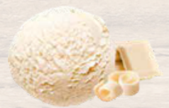
CHOCOLAT BLANC 2.5 L (16995)