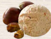
MARRON GLACÉ 0.5 L (19339) 2.5 L (29990)