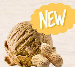
CACAHUÈTE 0.5 L (1856) 2.5 L (1857)