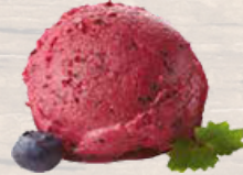
MYRTILLE 0.5 L (19350) 2.5 L (29995)