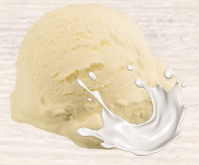
FLEUR DE LAIT 0.5 L (19332) 2.5 L (29991)