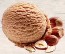
NOISETTE 0.5 L (19340) 2.5 L (29988)