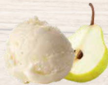
POIRE WILLIAMS 2.5 L (19801)