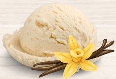
VANILLE 0.5 L (19336) 2.5 L (29984) 5 L (29994)