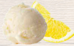
CITRON 0.5 L (19346) 2.5 L (29999)