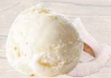
NOIX DE COCO 0.5 L (19341) 2.5 L (29987)