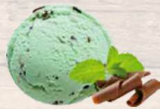
MENTHE CHOCOLAT 0.5 L (19333) 2.5 L (29989)