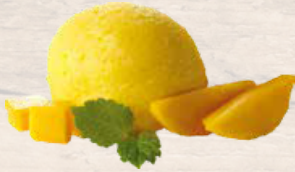
MANGUE 0.5 L (19349) 2.5 L (29996)