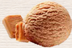
CARAMEL BEURRE SALÉ 0.5 L (19338) 2.5 L (29993)