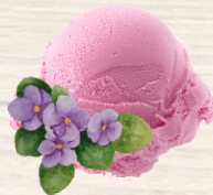
VIOLETTE 0.5 L (19343) 2.5 L (29982)