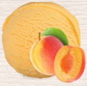
ABRICOT 0.5 L (19344) 2.5 L (19105)