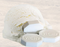
PASTILLE VICHY 2.5 L (16993)