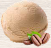
CAFÉ 0.5 L (19337) 2.5 L (19119)