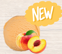
PÊCHE DE VIGNE 0.5 L (1885) 2.5 L (1884)