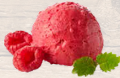
FRAMBOISE 0.5 L (19348) 2.5 L (29997)