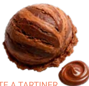
PÂTE À TARTINER MARBÉE 29711

Pâte à tartiner Lucien Georgelin (artisanale) et marbrage pâte à tartiner noisettes et cacao.