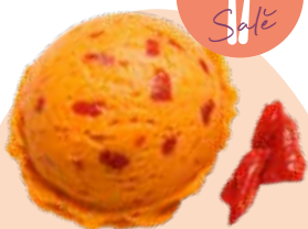
POIVRON PIQUILLOS 201531

D'un côté, la finesse du poivron piquillos, de l'autre, la puissance du piment d'Espelette. Un mariage étonnant qui réunit deux piliers de la gastronomie basque.