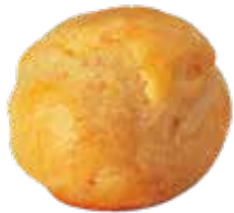
CHOU LUNCH PUR BEURRE 105144