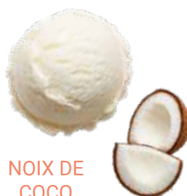
NOIX DE COCO 29741