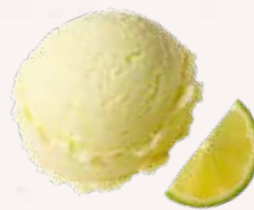
CITRON VERT 29733

Un sorbet acide mais fruité avec 27% de citron vert, jus et zeste.