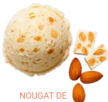
NOUGAT DE MONTÉLIMAR 19548

L'alliance du nougat de Montélimar et du miel, sublimée par le croquant des amandes caramélisées.