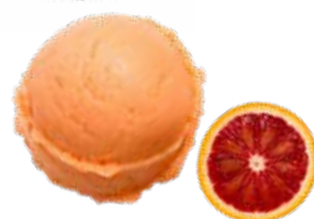
ORANGE SANGUINE 19589

Ce sorbet, riche en jus d'orange sanguine, offre des saveurs sucrées et acidulées qui ensoleillent votre palais.