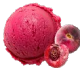
PECHE DE VIGNE 29742

Un sorbet tout en finesse avec plus de 70 % de pêche de vigne française.