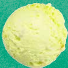
CITRON VERT 114084

Sorbete au jus et arôme naturel de citron et morceaux semi-confits de citron. Bac de 2.5L Colis de 4 bacs - UVC bac