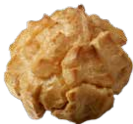
CHOU PARISIEN PUR BEURRE 55891

toque&tablier LA GAMME FRANCE POUR LES PROFITECHIFFES