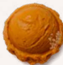
CARAMEL BEURRE SALE 29717

Au beurre de baratte salé à la fleur de sel de l'île de Ré et caramel aromatique.