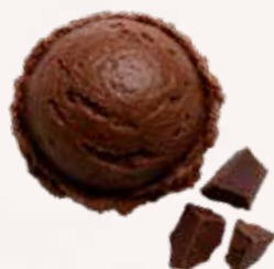
CACAO INTENSE 29731

Sorbet unique et intense, pour les puristes du cacao.