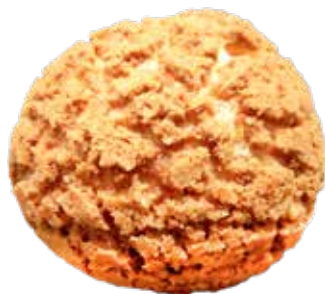
* CHOU CRAQUELIN CUIT 103202

A garnir directement selon les envies, à la crème ou aux fruits. Idéal pour réaliser des profiteroles.