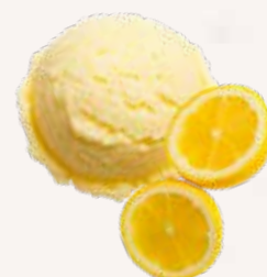
CITRON JAUNE 29732