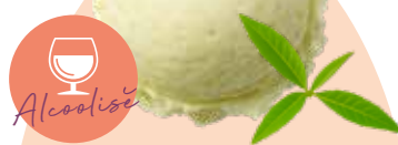
CITRON VERT VERVEINE 201533

L'alliance parfaite entre l'acidité du citron vert et la finesse des plantes. Ce sorbet issu de la célèbre liqueur Auvergnate vieillie en fût de chêne est une explosion de fraîcheur en bouche.