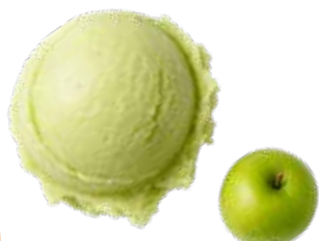
POMME VERTE 29744

Entre acidité et fraîcheur, dégustez ce sorbet issu de 70 % de pomme verte française.