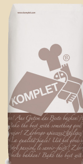
Complet plus sans sel ajouté

Le parfait mélange du blé, du seigle, du malt torréfié et de graines (tournesol, sésame, lin et concassé de soja).