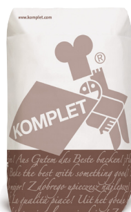
Pain à l'épeautre sans sel ajouté