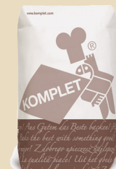
Pain forestier 50 sans sel ajouté