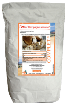
Novem campagne sans sel ajouté