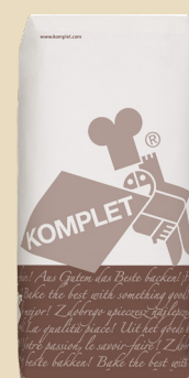
Préparation pain au maïs sans sel ajouté