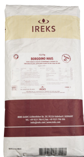
Rex borodino mais