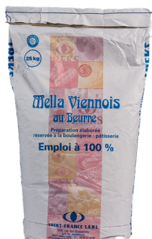
Mella viennois au beurre