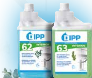
NETTOYANT SOLS ET SURFACES SURODORISANT RÉF 247354 - RÉF 247353