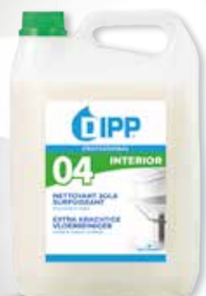
NETTOYANT SOLS SURPUISSANT RÉF 247365

Balai avec manche télescopique, housse microfibrés etseau essoreur. Idéal pour un nettoyage en profondeur sans se mouiller les mains, sur tous types de sols.