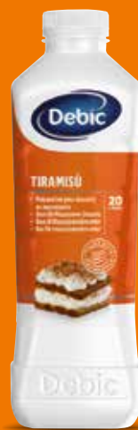
172701 TIRAMISÙ Bouteille de 1L Colis de 6 bouteilles