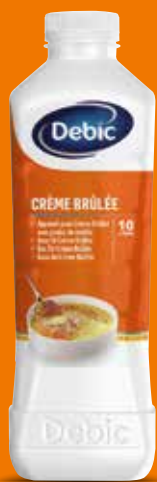
65266 CRÈME BRÛLÉE VANILLE BOURBON Bouteille de 1L Colis de 6 bouteilles