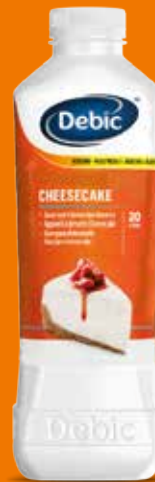
16747 CHEESECAKE Bouteille de 1L Colis de 6 bouteilles

* Attribution en fin d'opération par votre distributeur habituel. Dans la limite des stocks disponibles.