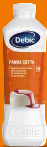
551082 PANNA COTTA Bouteille de 1L Colis de 6 bouteilles