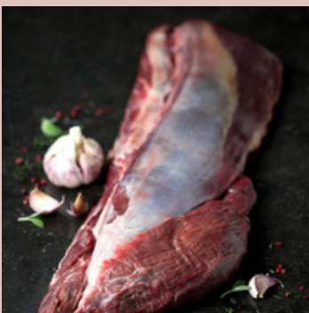
FILET DE BOEUF VBF 148042 POIDS 3 KG +