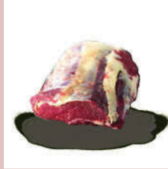
ENTRECOTE PRENUM RUBIE VBF 49710 POIDS 4/5 KG +