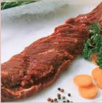
ONGLET DE BOEUF UE 168963 SHT DE 1.8 KG ENV.