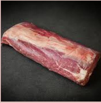
FAUX FILET UE 168967 POIDS 3/5 KG ENV.