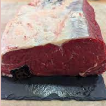
FAUX FILET CHAROLAIS VBF 174102 POIDS 7 KG ENV.