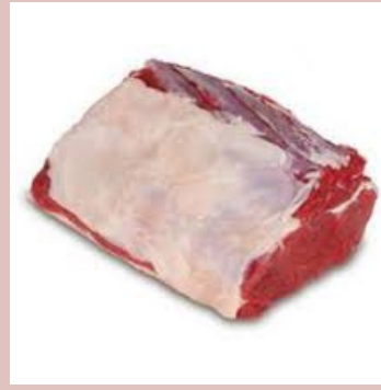
ENTRECOTE BOEUF UE 182688 POIDS 3 KG ENV.