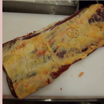
FAUX FILET 6 KG + VBF TARN 81 174043 POIDS 6 KG ENV.