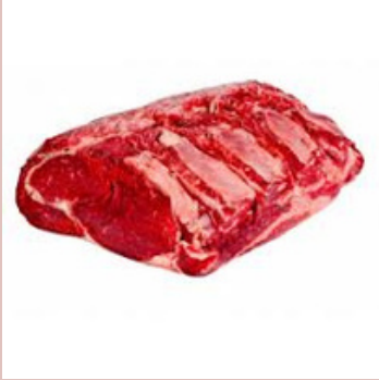
ENTRECOTE BOEUF VBF TARN 81 120074 POIDS 3 + KG