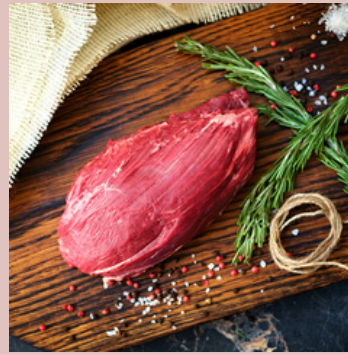
POIRE DE BOEUF UE 167953 POIDS 1.5 KG ENV.