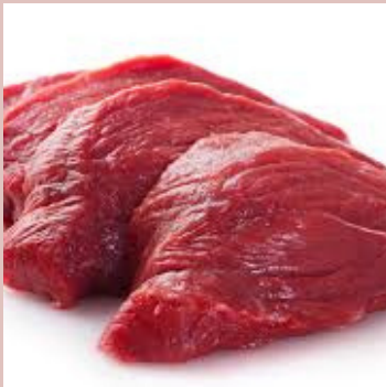
MACREUSE UE 169219 POIDS 4 KG ENV