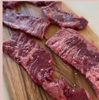
HAMPE DE BOEUF UE 168965 POIDS 1.8 KG ENV.