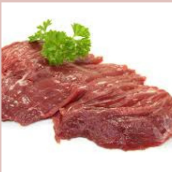
BAVETTE ALOYAU PAD UE 182685 SHT DE 3 KG ENV