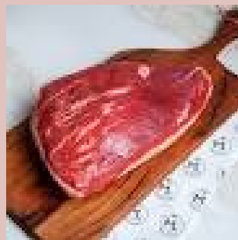
PICANHA BOEUF ANGUS UE 146540 POIDS 1.2 KG ENV