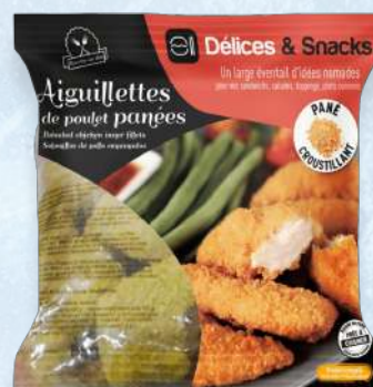
AIGUILLETTE POULET PANÉ CUIT HALAL - CDT : 5 X 1KG