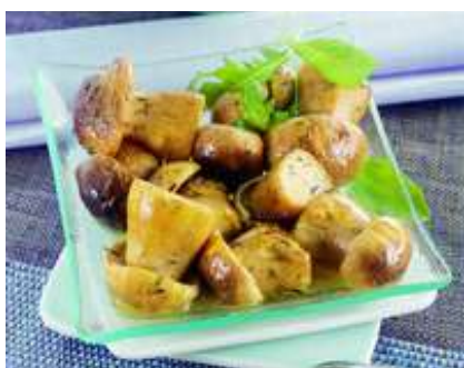
CEPE BOUCHON - CDT : 5 X 1KG EAN 3112309998456 CODE 107220