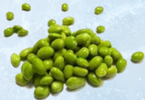
FÈVE DE SOJA PRÉCUIT - CDT : 5 X 1KG EAN 3421110404477 CODE 101844