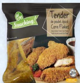
AIGUILLETTE POULET CUIT CORNFLAKE ÉPICE HALAL - CDT : 5 X 1KG