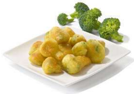
BEIGNET BROCOLI - CDT : 6 X 1KG EAN 3421112981471 CODE 105503