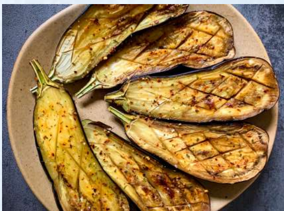
AUBERGINE GRILLÉE - CDT : 5 X 1KG EAN 3421114114471 CODE 4376