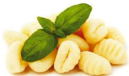
GNOCCHI POMME DE TERRE - CDT : 10 X 1KG EAN 3421115260474 CODE 103934