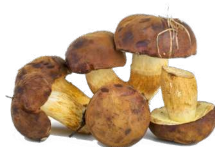
CEPE MORCEAUX - CDT : 5 X 1KG EAN 3112309996377 CODE 108177