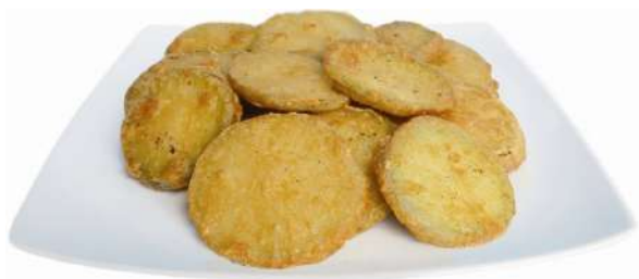
BEIGNET COURGETTE RONDELLE - CDT : 5 X 1KG EAN 3421113580475 CODE 105504