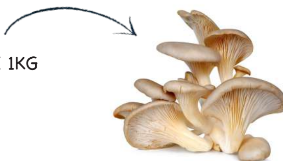
PLEUROTE MINIATURE - CDT : 5 X 1KG EAN 3083681012156 CODE 111125