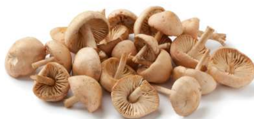
MOUSSERON 1KG - CDT : 5 X 1 EAN 3274613050494 CODE 103389