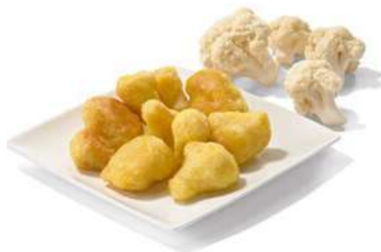
BEIGNET CHOU FLEUR - CDT : 6 X 1KG EAN 3421113480478 CODE 105505