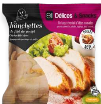
FILET POULET ROTI HALAL TRANCHETTE - CDT : 5 X 1KG EAN 5941645104263 CODE 88356