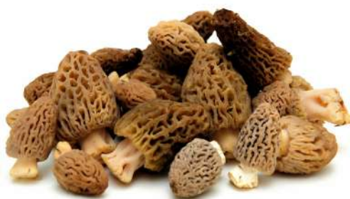
BRISURE MORILLE - CDT : 5 X 1KG EAN 3760175931239 CODE 88785