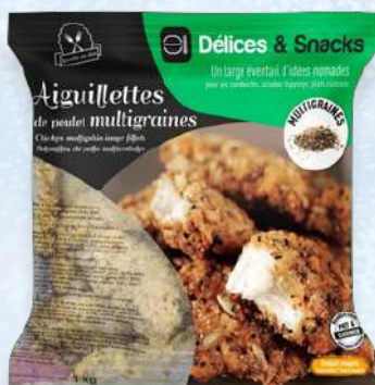
AIGUILLETTE POULET CUIT MULTIGRAINE HALAL - CDT : 5 X 1KG