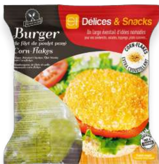
BURGER FILET POULET CUIT PANÉ CORNFLAKES HALAL - CDT : 5 X 1KG EAN 3760116242912 CODE 798