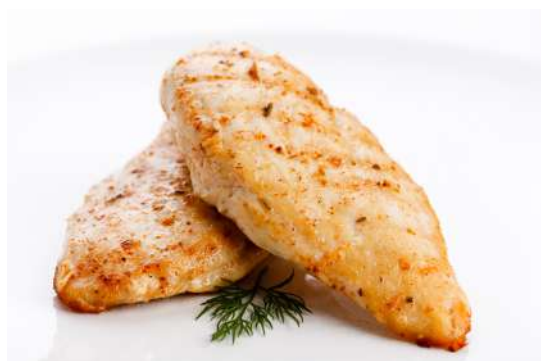
FILET POULET ROTI 90/110G HALAL - CDT : 5 X 1KG EAN 5908311707845 CODE 4914