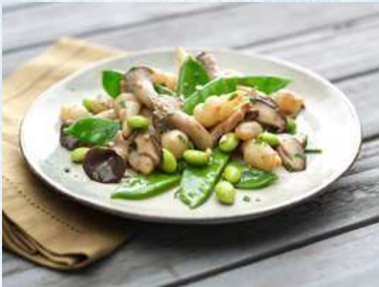
POÊLÉE GOURMANDE CROSNE FÈVE - CDT : 5 X 1KG EAN 3434410074806 CODE 88751