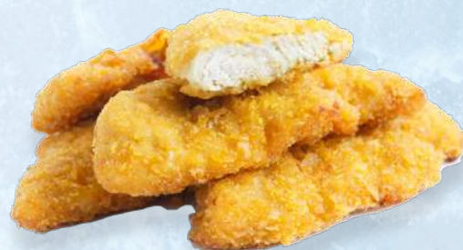
AIGUILLETTE POULET CUIT CORNFLAKE UE - CDT : 5 X 1KG