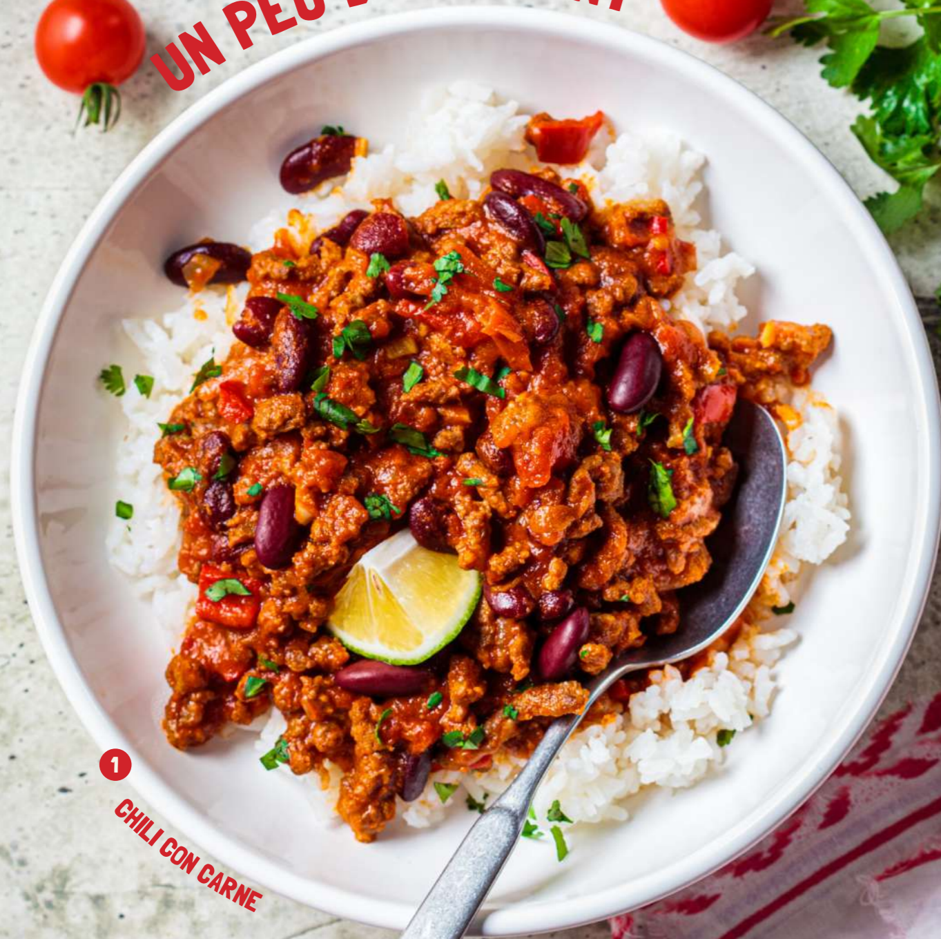
1 CHILI CON CARNE