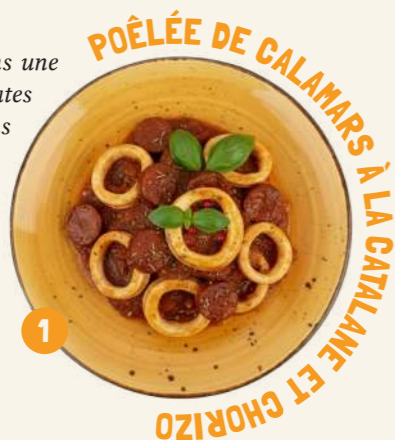
1 POËLÉE DE CALAMARS À LA CATALANE ET AU CHORIZO

Calamars mijotés dans une sauce à base de tomates composées, d'oignons et de chorizo et assaisonnée avec des herbes de Provence, de l'origan et du piment.