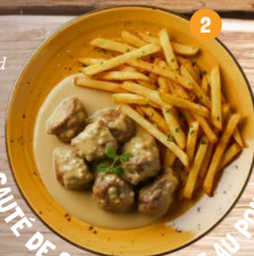
2 SAUTÉ DE CANARD SAUCE AU POIVRE VERT

Manchons de canard braisés puis mijotés dans une sauce crémeuse à base de poivre vert et de Cognac*.