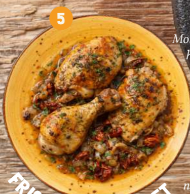
5 FRICASSÉE DE POULET

Morceaux de poulet (pilon et haut de cuisse) dorés au four, accompagnés d'un jus à base d'échalotes suées dans l'huile d'olive avec des herbes de Provence et des tomates séchées. Le tout est rehaussé d'un filet de vinaigre de Xérès et d'une note anisée (Pastis*).