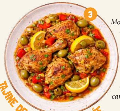
TAJINE DE POULET CITRONNÉE

3 TAJINE DE POULET CITRONNÉ AUX OLIVES ET POIVRONS 165625 - 2,72 kg