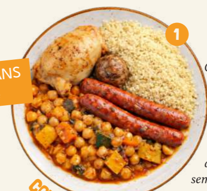
COUSCOUS EN KIT