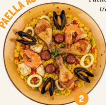
2 PAELLA AU POULET

Paëlla cuisinée selon une recette traditionnelle espagnole. Le riz est agrémenté d'anneaux de calamars, de poivrons, d'oignons et de petits pois cuits dans un jus au fumet de poisson et aux épices. Ce riz est accompagné d'une garniture de fruits de mer, de chorizo et de poulet (pilon et haut de cuisse).