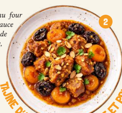
TAJINE D'AGNEAU MIEL, ABRICOT ET PRUNEAUX

Morceaux d'agneau dorés au four puis mijotés dans une sauce parfumée d'un mélange de miel et d'épices (coriandre, paprika, cumin, cannelle, gingembre), accompagnés d'abricots secs et de pruneaux.