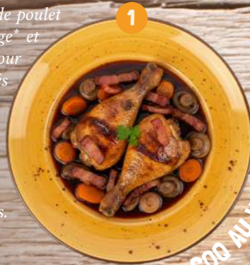
1 COQ AU VIN

Pilons et hauts de cuisse de poulet marinés dans du vin rouge* et des aromates, dorés au four et longuement mijotés dans une sauce au vin rouge agrémentée d'une garniture à base de lardons fumés, d'oignons grelots, de carottes et de champignons de Paris.