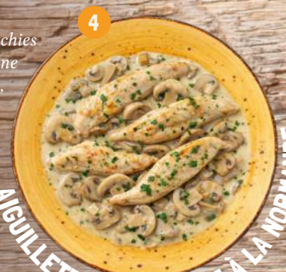
4 AIGUILLETTES DE POULET À LA NORMANDE

Aiguillettes de poulet blanchies et cuisinées dans une sauce à base de crème, de vin blanc*, riche en champignons de Paris et parfumée avec du Calvados*.