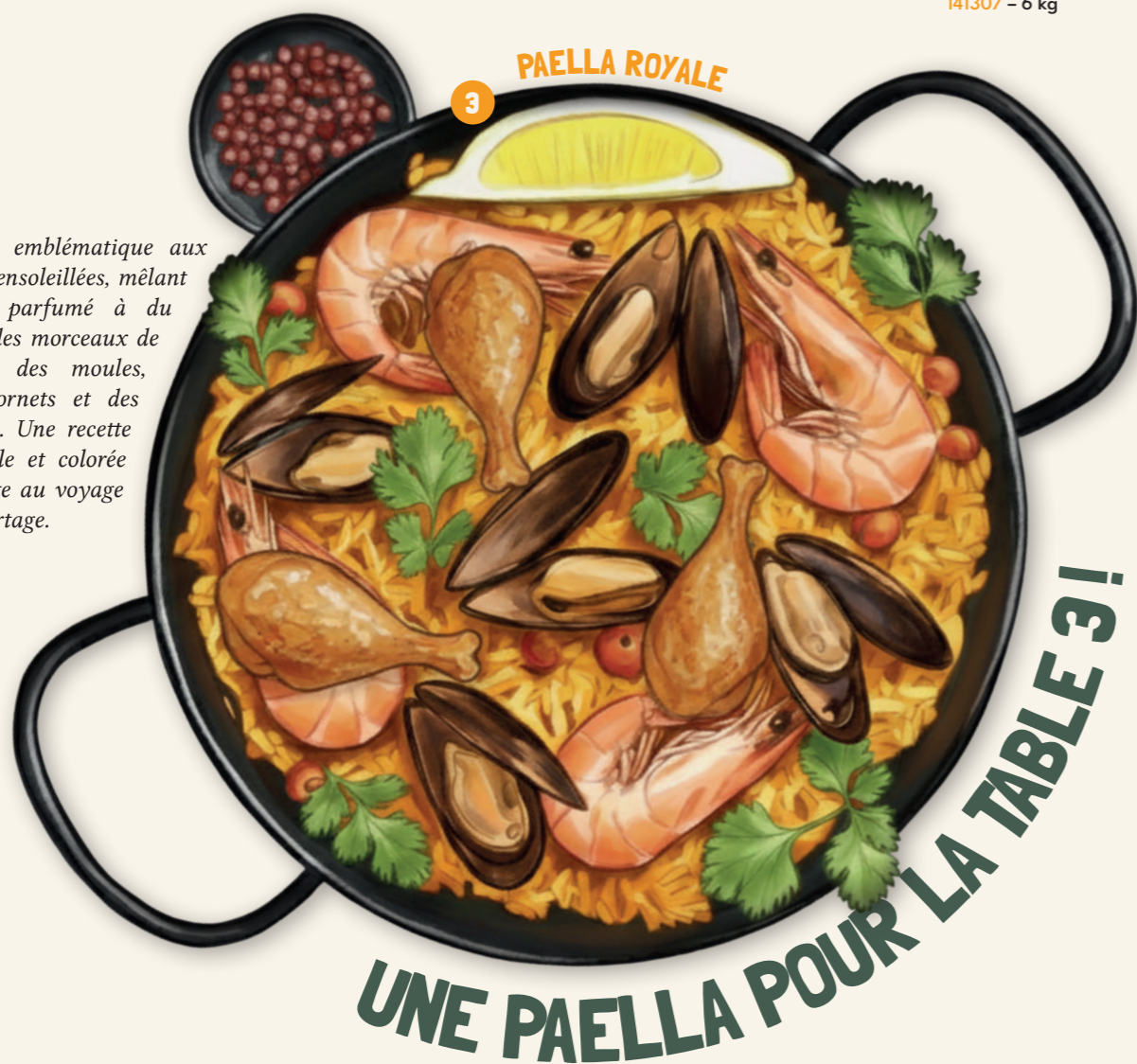
3 PAELLA ROYALE

Un plat emblématique aux saveurs ensoleillées, mêlant un riz parfumé à du poulet, des morceaux de poisson, des moules, des encornets et des crevettes. Une recette conviviale et colorée qui invite au voyage et au partage.