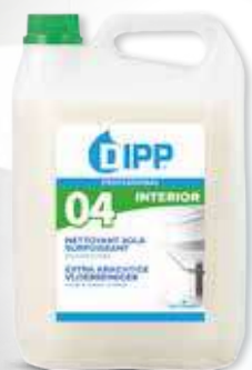
NETTOYANT SOLS SURPUISSANT RÉF 247365 19,90€ H.T. le bidon

Balai avec manche télescopique, housse microfibras etseau essoreur. Idéal pour un nettoyage en profondeur sans se mouiller les mains, sur tous types de sols.