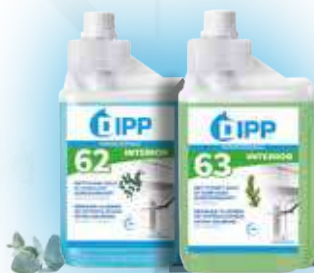
NETTOYANT SOLS ET SURFACES SURODORISANT RÉF 247354 - RÉF 247353 11,50€ H.T. le bidon