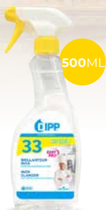
Dipp brillanteur inox 247412 - Spray de 500ml Colis de 6 sprays 12,35€** h.t. le spray