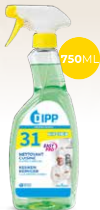
Dipp nettoyant cuisine 247352 - Spray de 750ml Colis de 6 sprays 7,20€** h.t. le spray