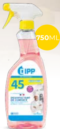
Dipp désinfectant de contact 247485 - Spray de 750ml Colis de 6 sprays 13,20€** h.t. le spray