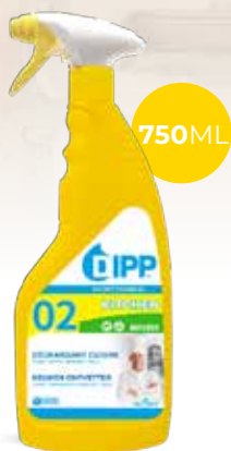
Dipp dégraissant cuisine mousse 247350 - Spray de 750ml Colis de 6 sprays 10,20€** h.t. le spray