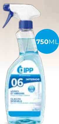
Dipp nettoyant vitre miroir 247364 - Spray de 750ml Colis de 6 sprays 5,10€** h.t. le spray