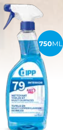
Dipp nettoyant table & multi-surfaces 247369 - Spray de 750ml Colis de 6 sprays 6,95€** h.t. le spray