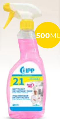
Dipp nettoyant détartrant inox 247359 - Spray de 500ml Colis de 6 sprays 7,25€** h.t. le spray